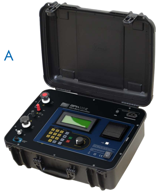
Foto ilustrativa. Smartphone no incluido.